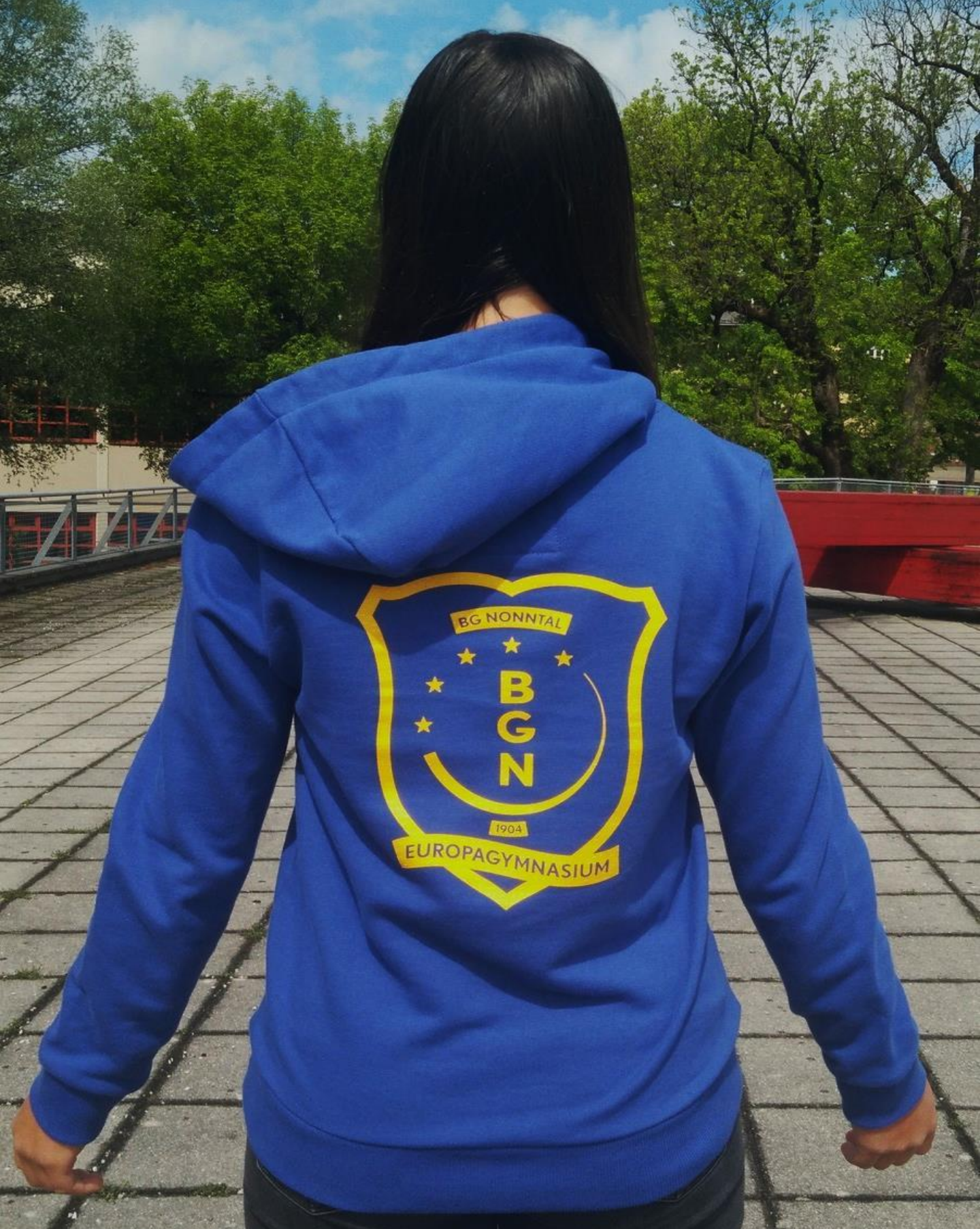
Der Blauton wird dunkler als auf dem Bild